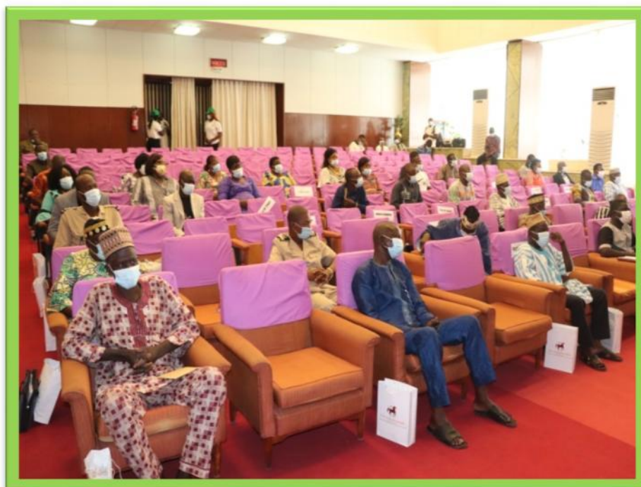
Les invités de l'évènement