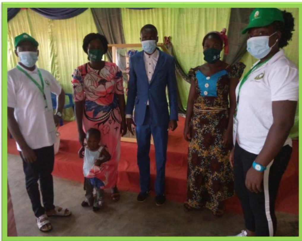
Visite des 2 volontaires de Kara à Kétao