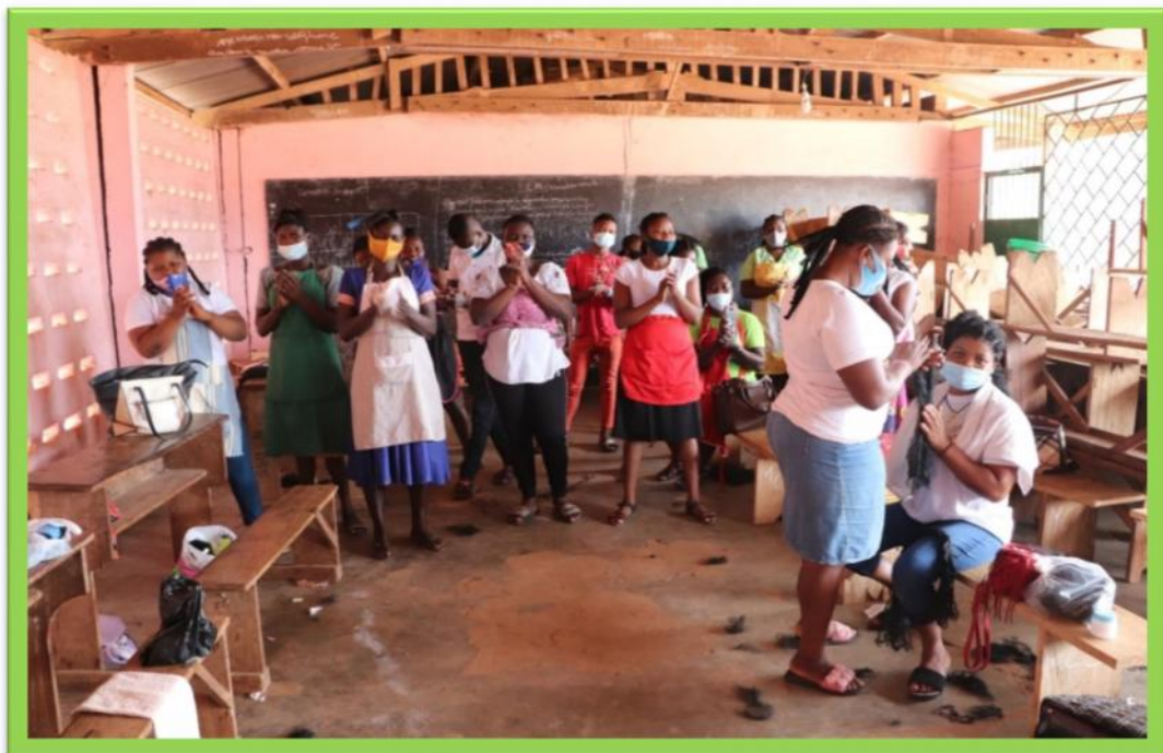
Une séance de sensibilisation de la drépanocytose et la grossesse précoce aux apprenties coiffeuses du centre (CORSJD)