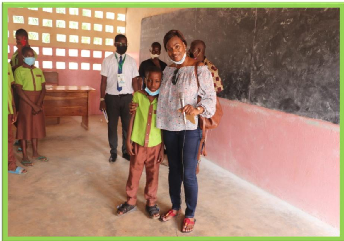
La présidente avec le meilleur élève du Complexe Aux Ames bien Nées.