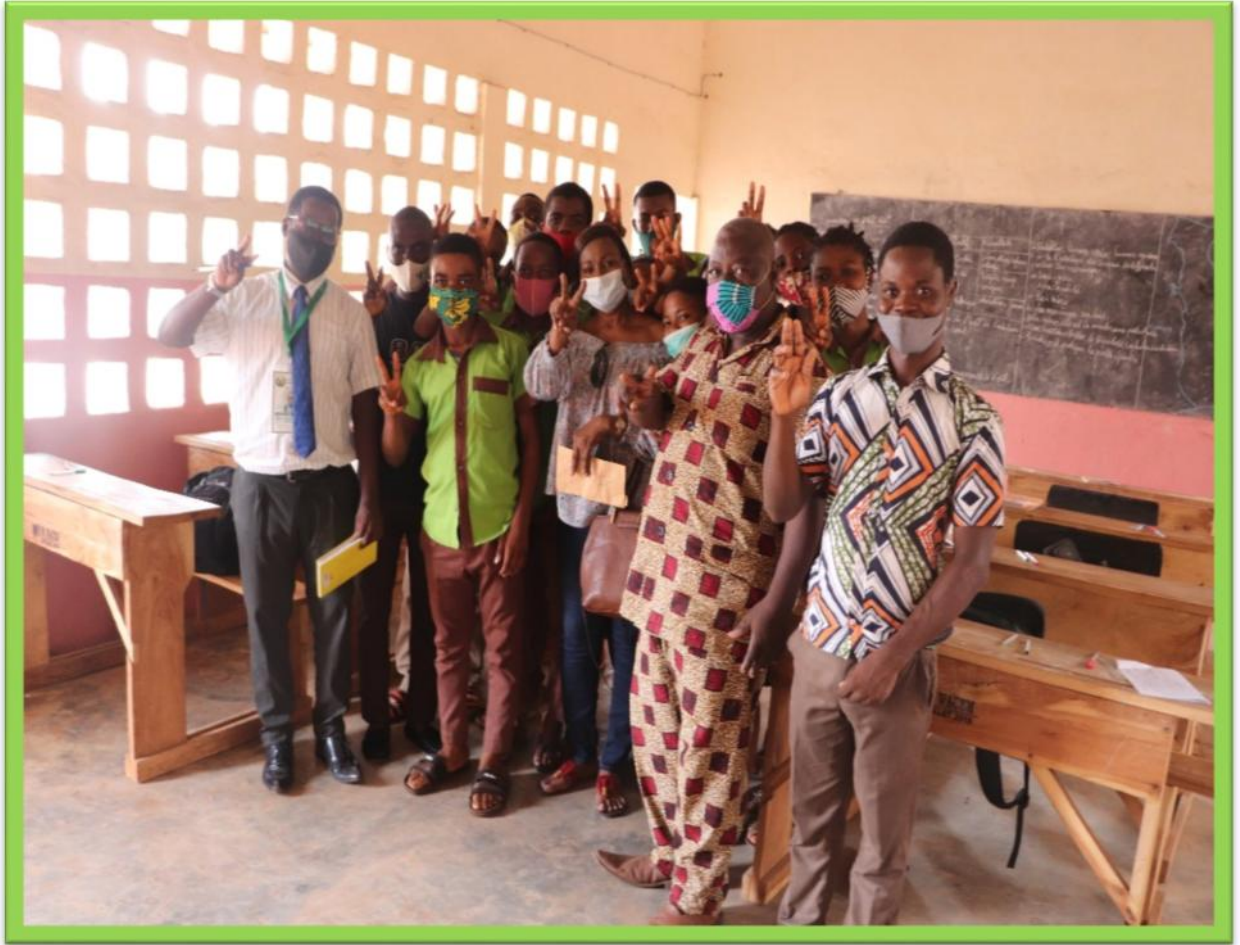
Photo de famille avec le staff de l'ONG, les élèves et le corps enseignant du complexe scolaire AUX Ames bien Nées.