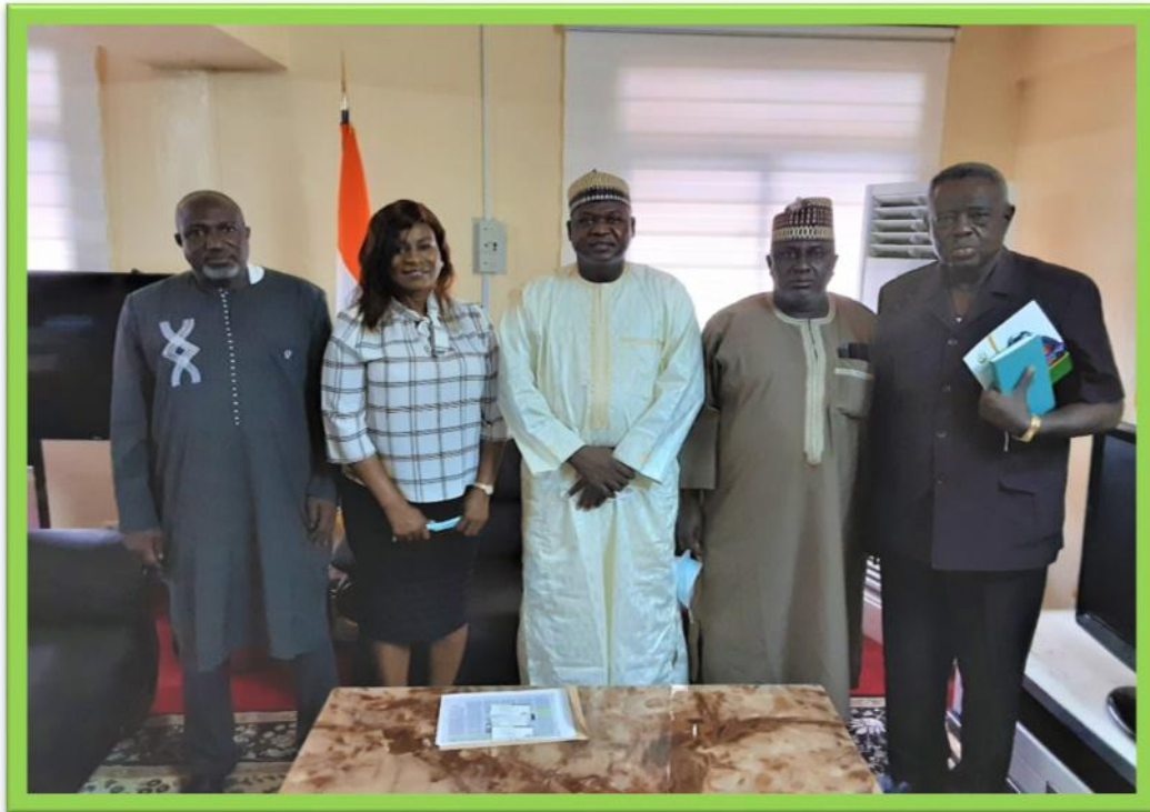
Photo de famille le staff du ministre de la santé du Niger entouré de Mme STONE et de ses collaborateurs