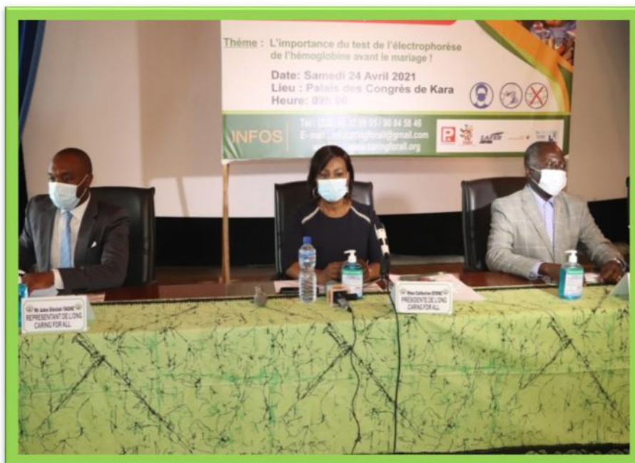
De votre gauche à votre droite : le représentant local de l'ONG et la Présidente, et Monsieur le Préfet de la KOZAH.