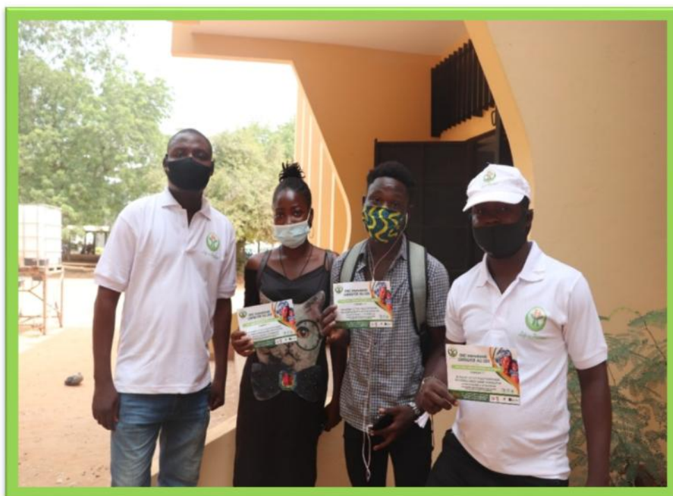
L'Equipe de l'ONG avec des étudiants heureux d'avoir été visités par notre équipe

L'équipe de l'ONG s'est rendue au Campus Universitaire de Lomé pour une sensibilisation sur la drépanocytose et le phénomène des jeunes filles mères abandonnées dans notre pays.