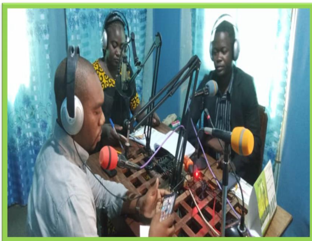
Les animateurs de la Radio missionnaire et à Kozah FM et l'équipe de l'ONG pour expliquer le but de ce lancement à la population de la KOZAH.

En prélude à ce lancement l'équipe est arrivée sur les radios de la région de la Kozah pour expliquer le but et le contenu du programme de lancement à la population.