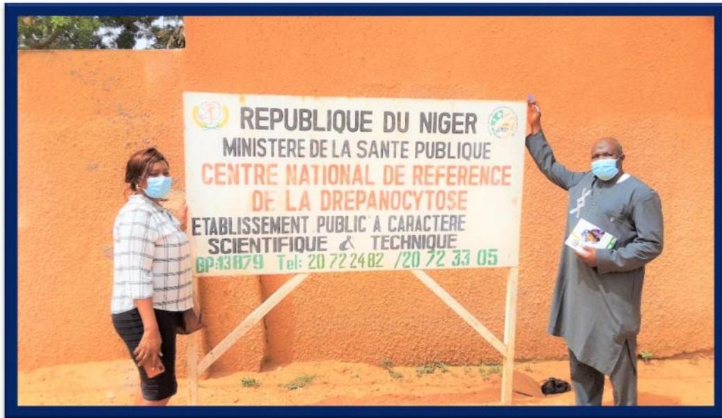
La Présidente de l'ONG et le Directeur du Centre National de Recherche et de Soins aux Drépanocytaires (CNRSD) du Niger