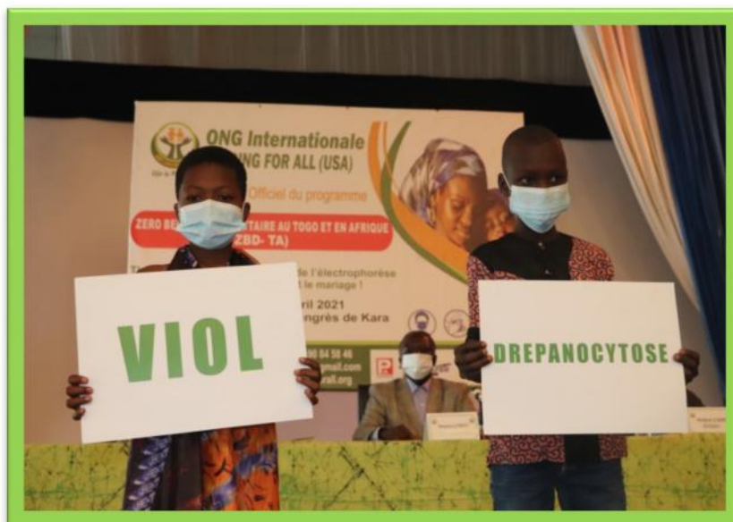
Les thématiques du programme VIOL et Drépanocytose