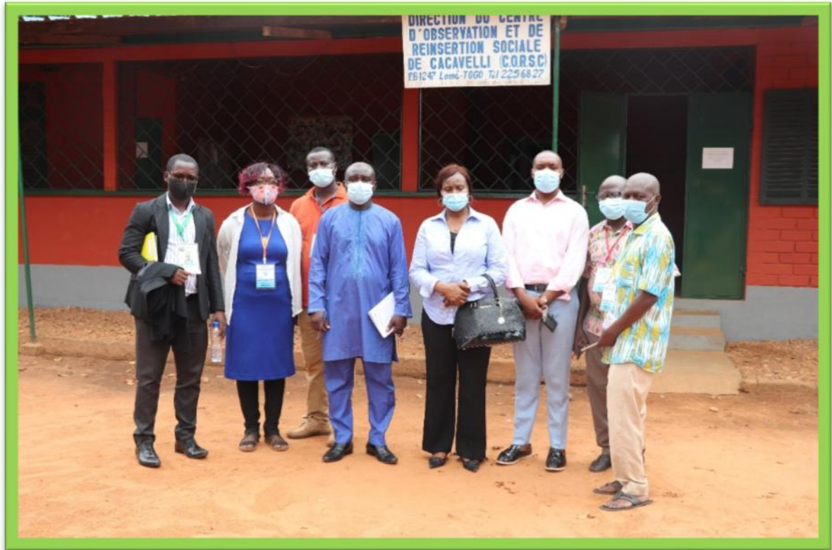
Photo de famille de l'ONG et l'envoyé spécial de Madame la Ministre et le personnel du Centre