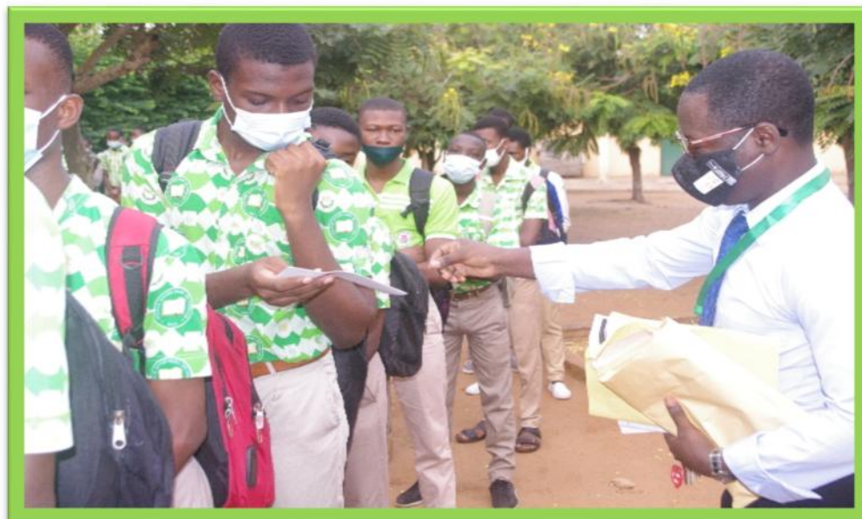
Distribution de prospectus aux élèves