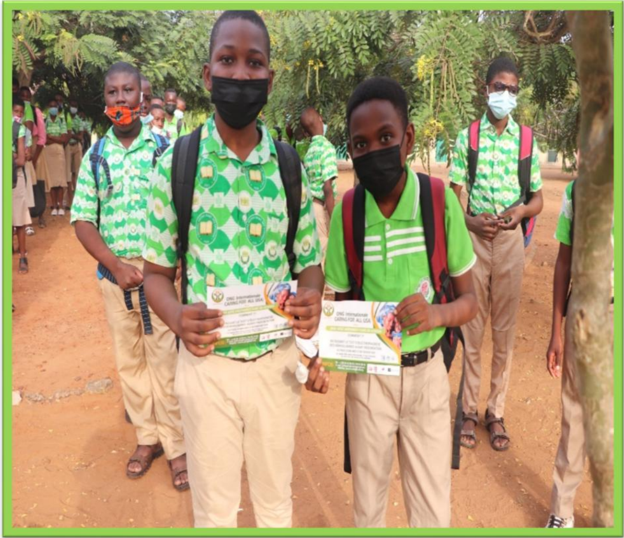
Les collégiens visiblement conscients et heureux d'avoir bénéficié de cette sensibilisation