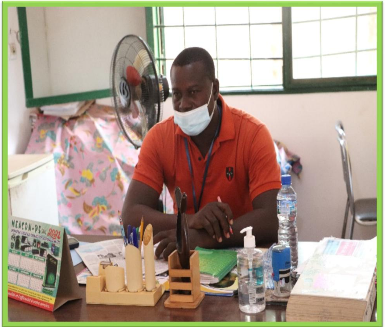
Monsieur le Directeur du Centre (CORSJD)