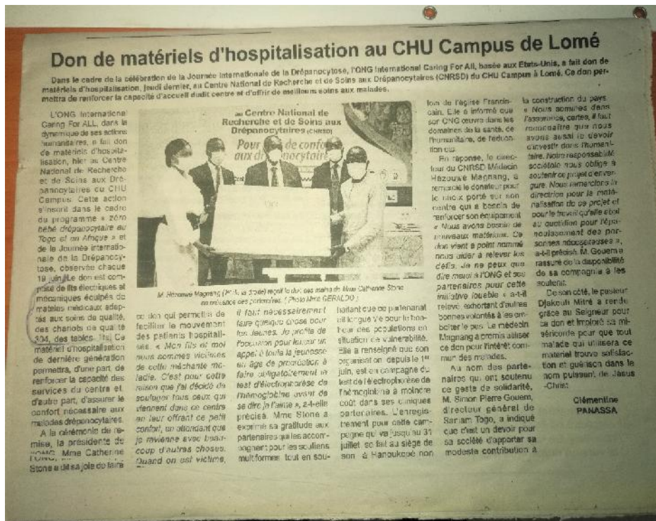
La revue de presse de la cérémonie de remise de don de matériels d'hospitalisation